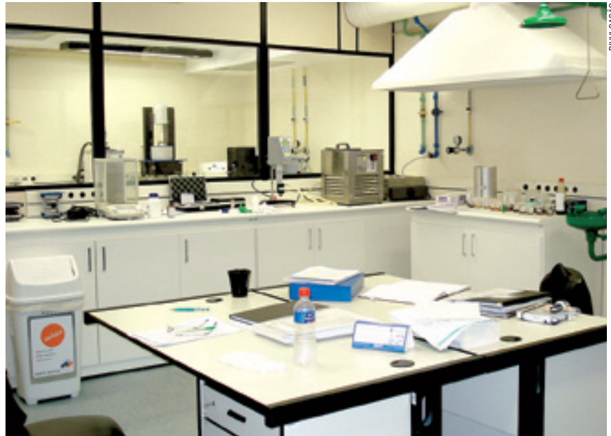
Laboratório de Caracterização de Materiais da Pucrs

Essa parceria resultou em um produto que contém solvente não-orgânico, ou seja, um material completamente isento de qualquer agressão à saúde de quem utilizá-lo.