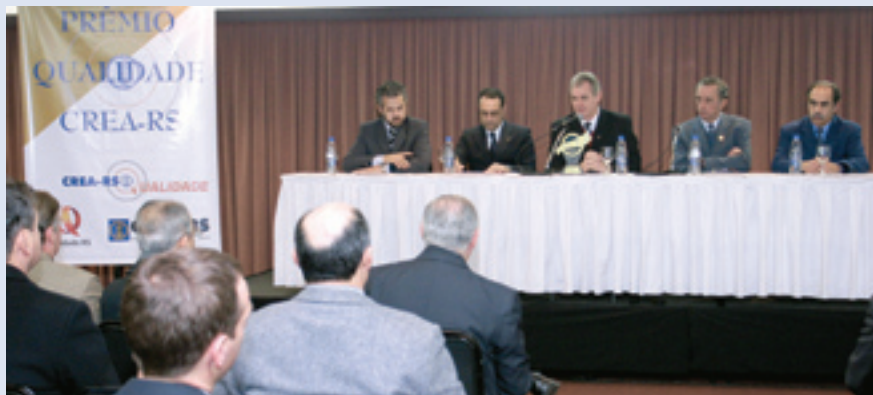
Prêmio lançado em Porto Alegre recebe inscrições até outubro